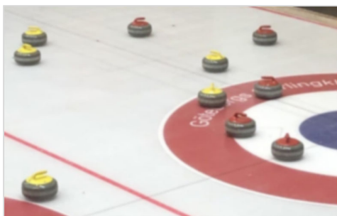
Ja, på tok för många stenar för figurspel!